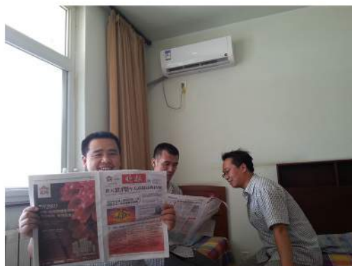
炎炎夏日宿舍空调全覆盖