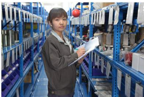
员工敬业度大大提升