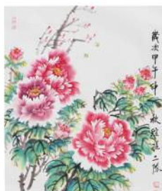
国画作品《花开富贵》