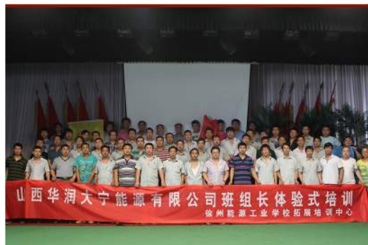
班组长体验式培训