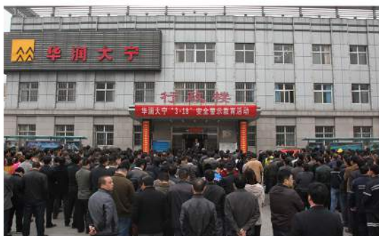
安全警示教育活动

全员安全培训，旨在提高从业人员的安全意识和安全技能，做到百分之百持证上岗。通过组织每年安全目标责任书签订仪式、“3.18”安全警示日活动、安全生产月、安全知识竞赛、“手指口述”、“应知应会”抽查等举措，提高全员安全意识，规范操作行为，降低安全风险。