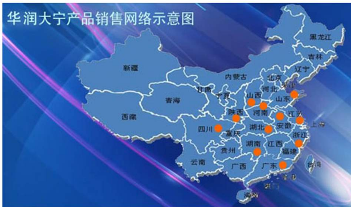
华润大宁产品销售网络示意图

华润大宁高度重视与客户的长期合作、共同发展。始终坚持“阳光操作、诚实守信、洞悉需求、合作共赢”的销售理念，时刻关注客户需求并快速响应，以诚信之心尊重客户，善待客户，坚持以优质的煤炭产品，可靠的煤源保障，真诚的客户服务，为客户创造更大的价值，实现互利共赢。