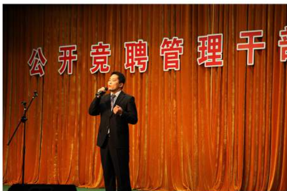
公开竞聘管理岗位